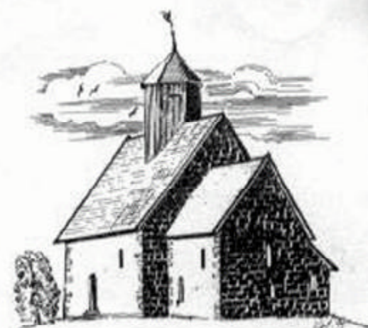
TINGELSTAD GAMLE KIRKE ELLER ST. PETRI (Den gamle Tingelstadskirke) 1100-tallet