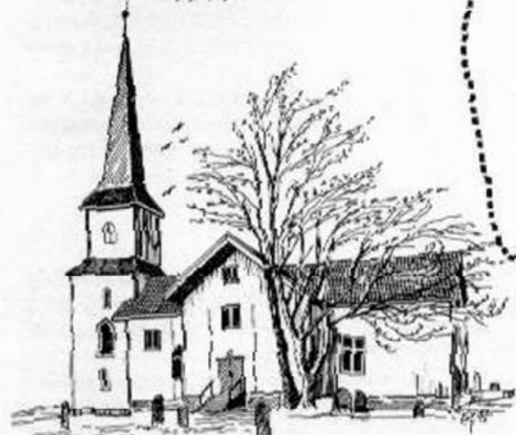
NES KIRKE (Neskirke) 1730