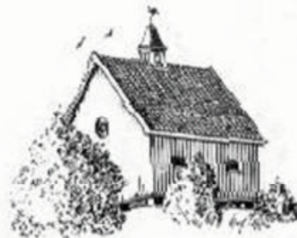
RØYSLUM KAPELL (Røysumkapellet) 1980