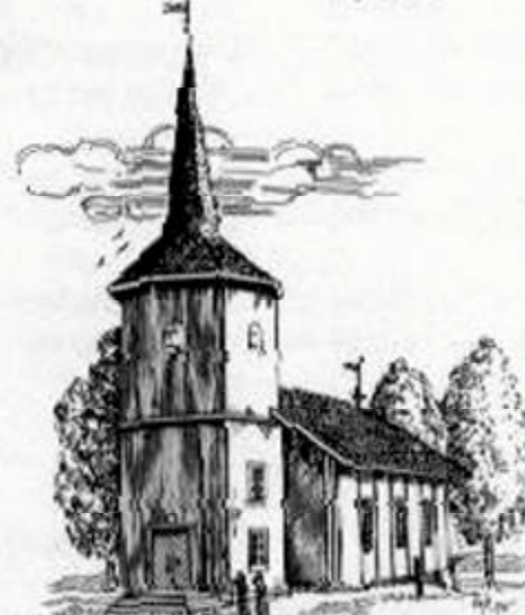
SØRLUM KIRKE (Sørslumkirke) 1861