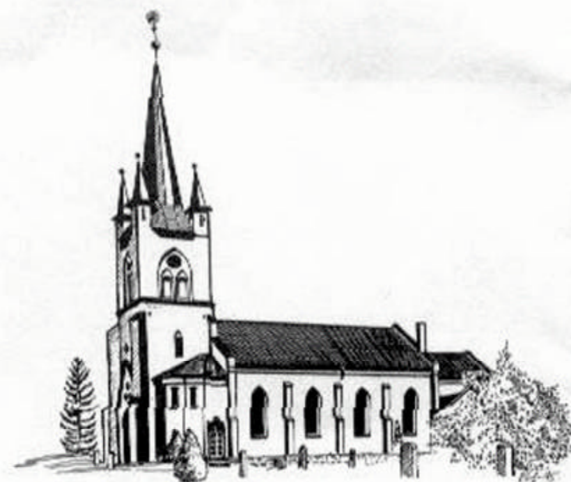
TINGELSTAD NYE KIRKE (Den nye Tingelstadskirke) 1866