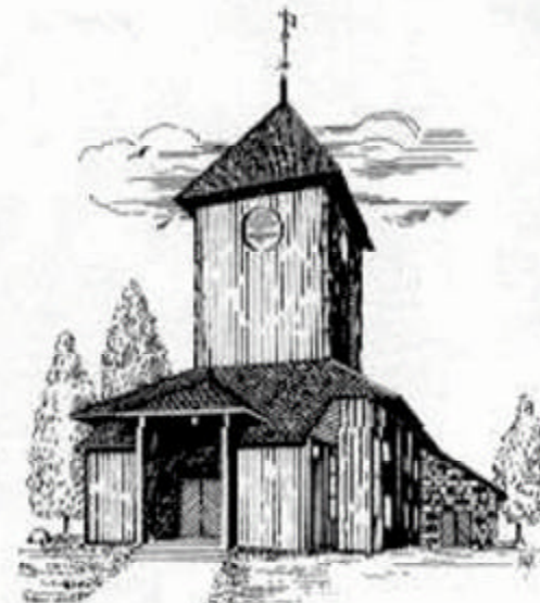
ÅL KIRKE (Ålskirke) 1930