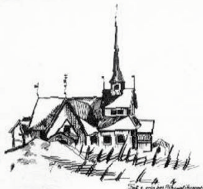
GRINDAKER STAVKIRKE (Grindakerskirkja) ca. 1150-1866