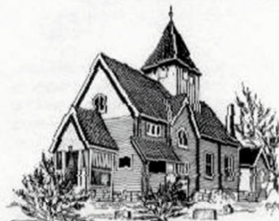
MOEN KIRKE (Moenkirke) 1914