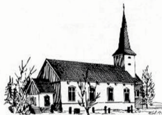
GRYMYR KIRKE (Grymyrskirke) 1899