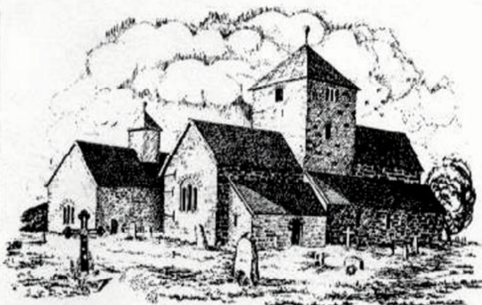
SØSTERKIRKEN NIKOLAIKIRKA MARIAKIRKA ca. 1150 ca. 1100 (Søsterkirken på Granavoll)